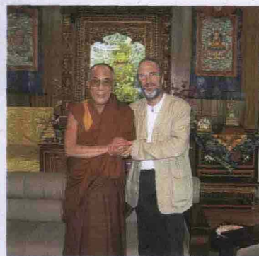
Raimondo Bultrini con il Dalai Lama. Nella foto grande: monaci buddisti a Dharamsala. Al centro: la copertina del libro di Bultrini