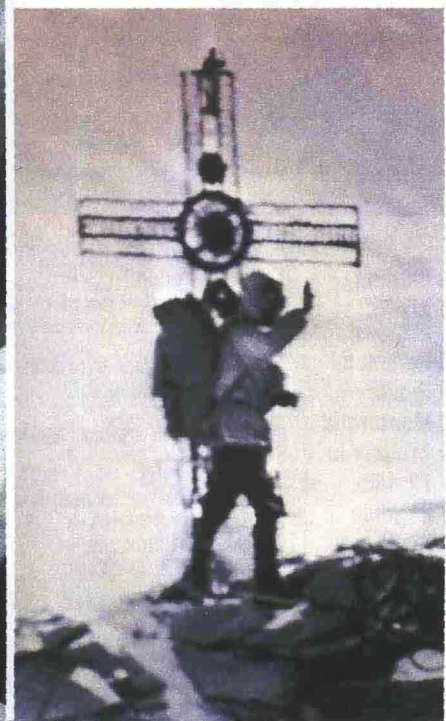
famiglia cristiana - n. 5/2009 - 91

«È morto l'alpinismo classico. Cioè quello con le regole morali non scritte, ma da tutti rispettate. Quello che fa della montagna la via per conoscere sé stessi. L'alpinismo dell'uomo che si impone su di sé e sulle asperità della natura attraverso il sacrificio e il rischio. Oggi il merito delle vittorie in montagna viene da fuori di noi, dalla tecnologia. Vittorie "regalate", scontate del vero prezzo».